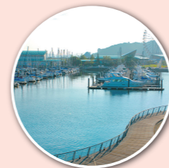
ラグナマリーナ 風景