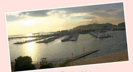
ラグナマリーナ夕焼け

☎0533-74-0662 [営業時間] 11:00～14:00 17:00～20:00 [定休日] 木曜日 www.kakurenomiyasagoromo.com/