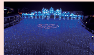
ラグナシア「水上イルミネーション」

01 ラグーナテンボス ☎0570-097117 www.lagunatenbosch.co.jp 無料シャトルバス運行 蒲郡駅→ラグーナテンボス ラグーナ内 回遊バス 蒲郡駅→変なホテル→ラグナシア～フェスティバルマーケット内