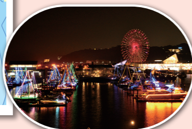
ラグナマリーナイルミネーション

渥美半島と知多半島に囲われた三河湾の奥に位置する、中部地区最大のマリーナ。穏やかな海況に恵まれ、釣りやクルージングスポットが近隣に多数点在しています。湾周辺にテーマパークやショッピングモール、温泉施設も充実しています。