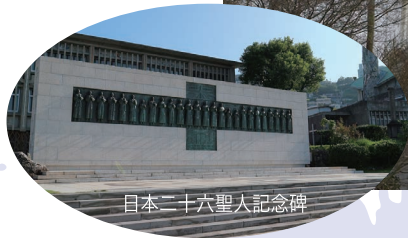
日本二十六聖人記念碑